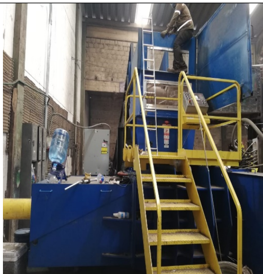
Fotografía No 4. Compactadora de acero