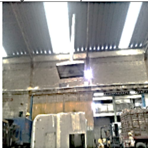
Fotografía No 6. Área de corte plasma