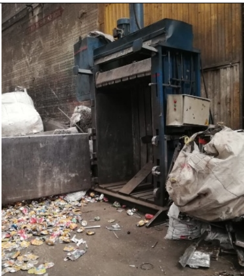
Fotografía No 3. Compactadora de aluminio